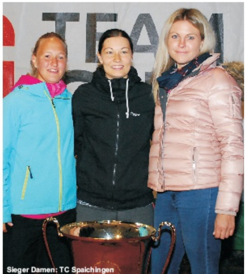
Sieger Damen: TC Spaichingen