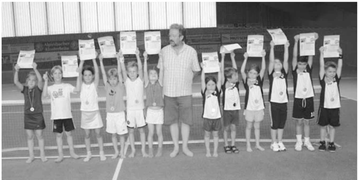
Finale U 8

So mussten in einer Dreier- und einer Zweiergruppe die Finalisten ausgespielt werden. Dabei waren in der Vorrunde zwei Partien bereits äußerst knapp, so dass die vielen Eltern am Ende mehr „geschafft“ waren als ihre Kinder, die bei der Gluthitze alles gaben.