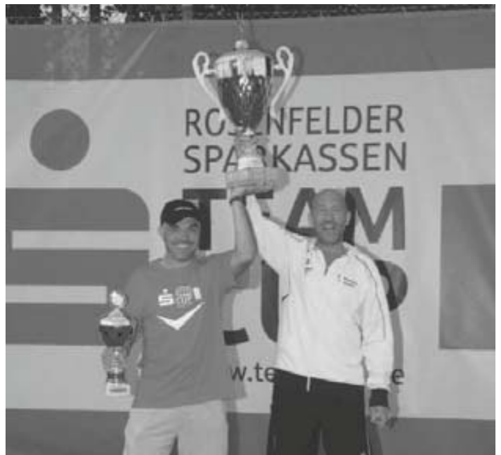
Sieger Herren 40: Rottweil