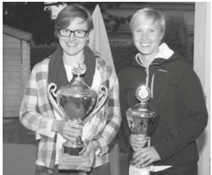
Sieger Damen: Balingen