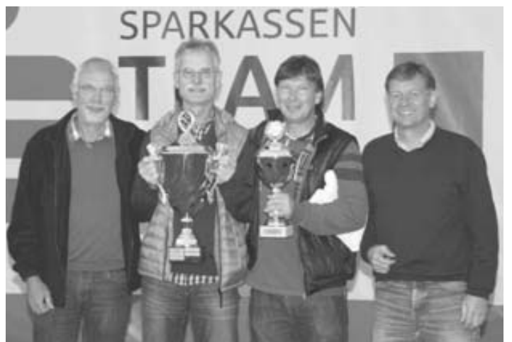
Sieger Herren 50: Balingen