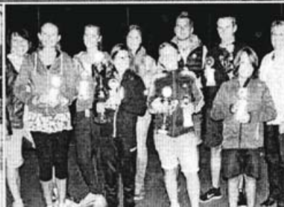
Eine ganze Menge stolze Pokalgewinner produzierten wieder einmal die Tennistadtmeisterschaften. Oben die erfolgreichen Teams der Aktiven, rechts unten: Sieger und Platzierte bei der Jugend. Links: Alle Mühe kostete es, die Plätze des TC Haigerloch am Sonntag nach einem schweren Wolkenbruch wieder bespielbar zu machen.

rinnen aus vier Haigerlocher Tennisclubs bei der 26. Auflage der Stadtmeister an den Start gegangen, um die Stadtmeister in elf Kategorien (Doppel bei den Erwachsenen, Einzel bei den Jugendlichen) zu ermitteln.