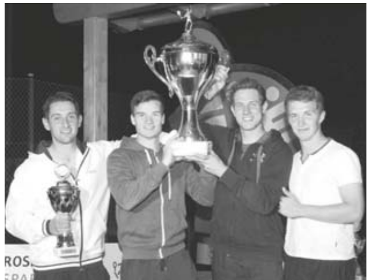
Sieger Herren: Böblingen