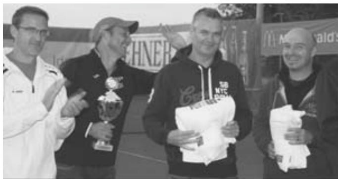
Platz 2 Herren 40: Westerheim