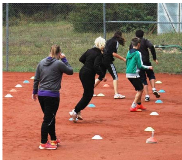
Seitstepp Vorwärts Rückwärts

„Tennis Zirkel Training“ - 4 Stationen - 6 Minuten pro Station 2 Minuten Pause – Stationswechsel – weiter geht's!!