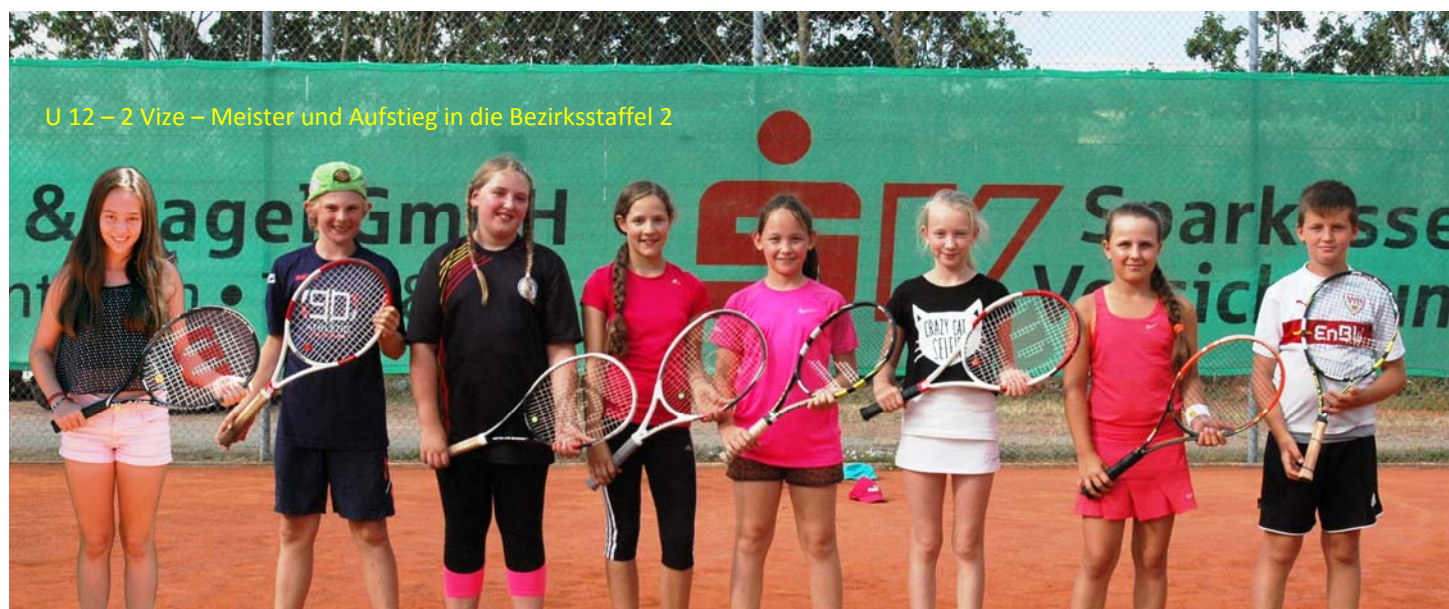
U 12 – 2 Vize – Meister und Aufstieg in die Bezirksstaffel 2