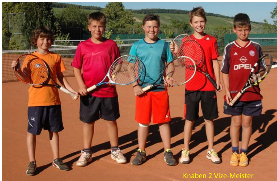
Knaben 2 Vize-Meister