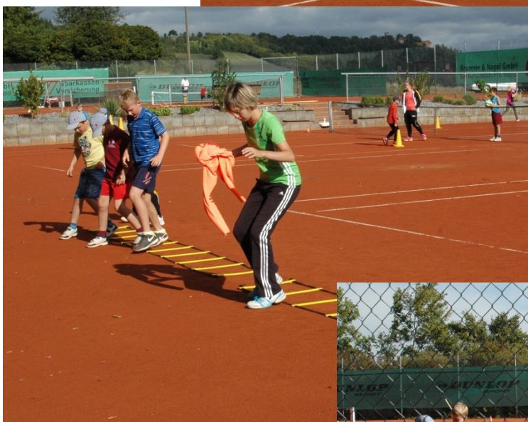
„Vormachen Nachmachen Üben!!“