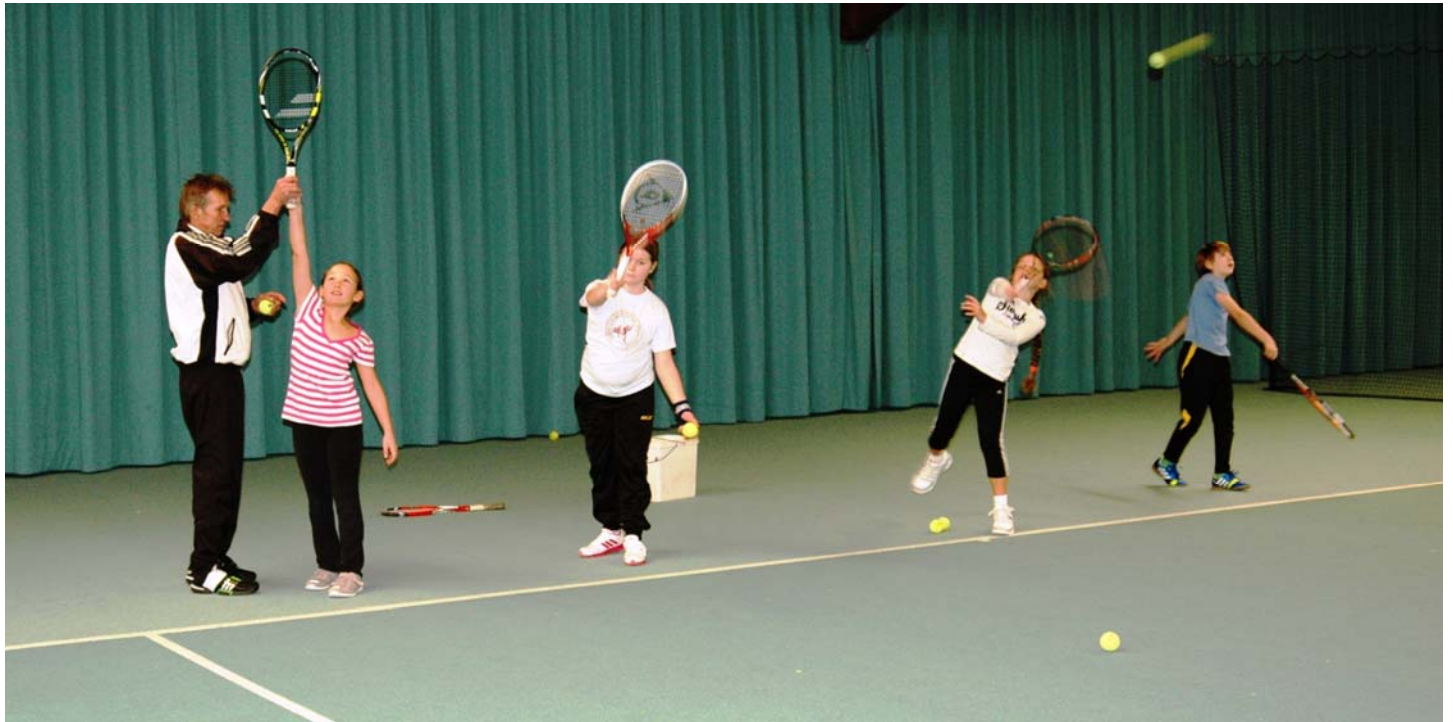
Aufschlagtraining mit den Mädchen und Knaben U-12

Durch die intensive Begleitung mit vielen Tipps konnten alle Teilnehmer im Lauf des Turniers sich von Match zu Match steigern und bei den vielen Ballwechseln sich ständig verbessern. Die Ergebnisse zeigen zum einen die gute Entwicklung der Kinder, zum anderen sorgen die Turniere immer wieder für Erlebnisse, die die Kinder an den Tennissport binden. Es macht ihnen riesig Spaß mit dabei zu sein und im Spiel an die eigenen Grenzen zu gehen und sich dabei immer wieder zu verbessern.