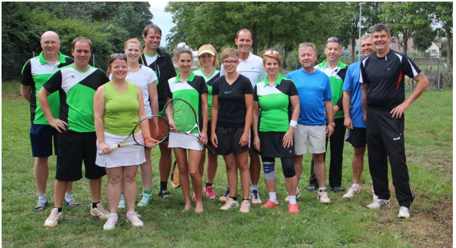
Die Hobbyteams aus Kleinglattbach und Markelsheim!

Im Vordergrund steht hier besonders der Spaß am Tennissport. Den Weg zum Tennis haben viele Erwachsene dabei über ihre Kinder gefunden. Aber nicht nur die Tenniseltern fanden über die angebotenen Schnuppertrainings den Weg zu den Hobbyspielern des TSV Markelsheim. Viele der Hobbyspieler haben auch Freunde und Bekannte zum Schnuppertraining mitgebracht bzw. wurden ehemalige Tennismitglieder wieder für den Tennissport begeistert. Mittlerweile treffen sich die Hobbyspieler bunt gemischt zum Spielen auch außerhalb der Trainingsstunden. Zudem nahm man in diesem Jahr das erste Mal an der Hobbyrunde teil. Die Mannschaft bestand dabei aus 6 Teammitgliedern. Zu den Begegnungen musste man dann jeweils mit 3 Männern und 3 Frauen antreten. Gespielt wurden in der ersten Runde ein Männerdoppel, ein Frauendoppel und ein Mixed-Doppel. In der zweiten Runde wurden dann 3 Mixed-Doppel ausgetragen. Die Spieler mussten dabei in der ersten und zweiten Runde nicht identisch sein, sodass man pro Begegnung auch mehr als 6 Spieler einsetzen konnte. Bei der ersten Teilnahme sammelten die Spieler wertvolle Erfahrungen. Gespielt wurde jeweils eine Auswärts- und eine Heimspielbegegnung gegen die Mannschaften aus Kleinglattbach und Leingarten. Neben dem Spaß beim Spiel mit der kleinen gelben Filzkugel hatte man viel Freude beim gemeinsamen Abschlusssessen nach jeder Begegnung.