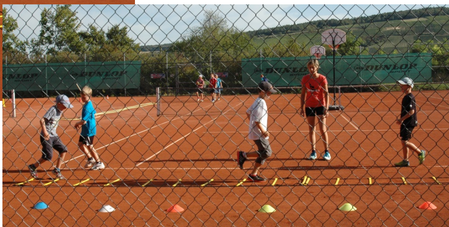
Auch 2016 werden wir mit vielen neuen Trainingsideen „Erlebnisse schaffen!“